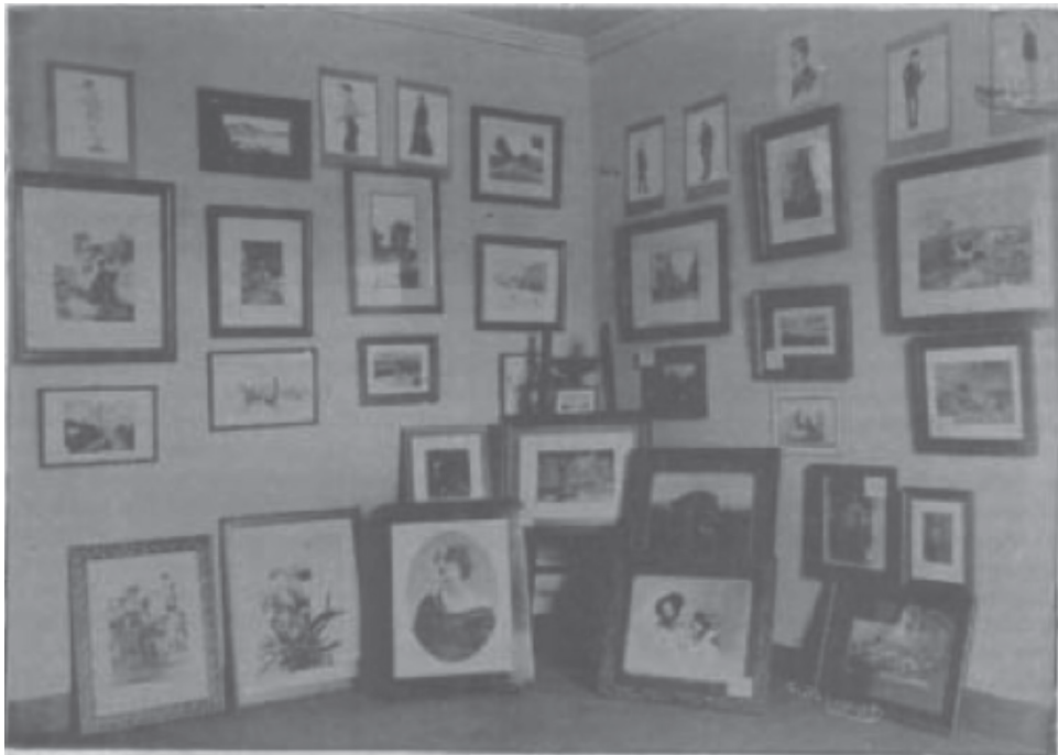
FOTOGRAFÍA 2 UN ÁNGULO DEL SALÓN DE ACUARELAS

Quiera el destino que esta Exposición marque una nueva era de prosperidad y de progreso y que sea el 15 de setiembre de cada año la fecha gloriosa que nos recuerda que en nuestras manos está mantener la tierra que nos legaron nuestros antepasados, llevando como divisa cada día las hermosas palabras de nuestro Himno Nacional: ¡Bajo el límpido azul de tu cielo, vivan siempre el trabajo y la paz! (ibíd.: 24).