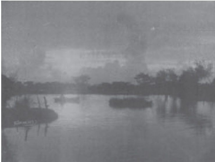
FOTOGRAFÍA 3 PAISAJE JOSEFINO TOMADA POR SOTILLO PICORNELL Y PREMIADA EN LA EXPOSICIÓN NACIONAL DE 1917

El verdadero objetivo de estas exposiciones residía en el interés de Tinoco por hacer buena imagen política. Estos eventos perseguían el mismo objetivo por el cual Costa Rica participó en las exposiciones internacionales de finales del siglo XIX; es decir, el de presentarse como un país agrícola, pacífico y educado ( Anuario de Estudios Centroamericanos , 1998: 91).