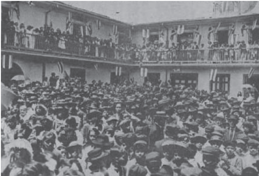
FOTOGRAFÍA 1 EXPOSICIÓN NACIONAL DE 1917 EDIFICIO JUAN RAFAEL MORA PORRAS DURANTE EL ACTO INAUGURAL

El Gral. Quirós en su discurso resaltaba el valor del trabajo: