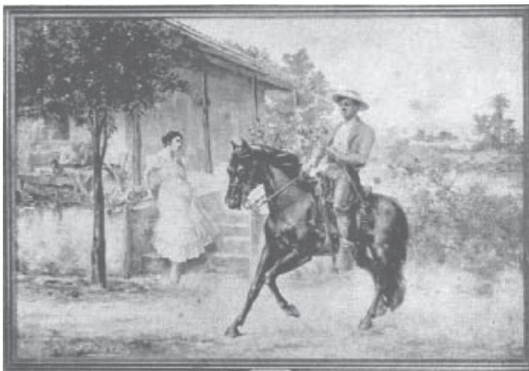
IMAGEN 2 “EN FEBRERO” DE TOMÁS PAVEDANO

En la Exposición Nacional de 1918, participaron pintores que no lo hicieron en el año 1917, destacándose entre ellos don Tomás Povedano, quien exhibió varios cuadros como “Concherías”, “Orquídeas”, “Muchacho tocando la dulzaina” y “En Febrero”. Para Eugenio de Triana, en este último lienzo, don Tomás se había inspirado en la obra “Concherías” de Aquileo J. Echeverría. Asimismo, pese a que varios críticos lo querían descalificar porque parecía un cuadro andaluz por el conjunto de elementos pintados y porque la “conchita” también parecía andaluza, para de Triana que la mujer tuviera un tipo andaluz no lo hace censurable, máxime que una niña costarricense sirvió de modelo, por lo que se debía de estar complacido en ese parecido, ya que constituye un claro testimonio de que Costa Rica ha sabido conservar en sus mujeres el noble abolengo de la madre España. Además, el cuadro presenta los detalles que hacen característico al campesino nacional. La dama que aparece en la pintura estaba con los pies descalzos, desarrollados libremente y estaba en la ruborosa actitud de la mujer tímida que espera ( Athenea , 1918: 420).