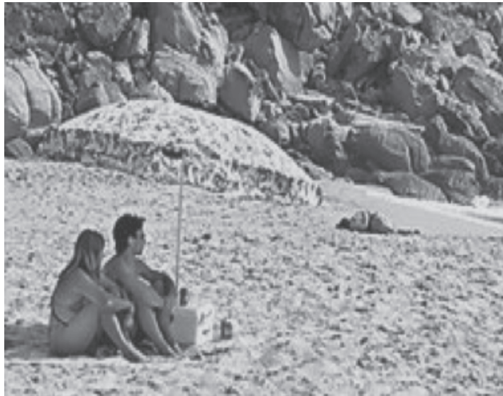
IMAGEN 1 CONTRADICCIÓN TURISMO E INMIGRACIÓN