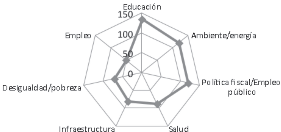
GRÁFICO 2 PRINCIPALES TEMAS DE PROMESAS ELECTORALES DIVULGADAS POR EL PERIÓDICO LA NACIÓN CAMPAÑA ELECTORAL, COSTA RICA, 2014 (EN ABSOLUTO)